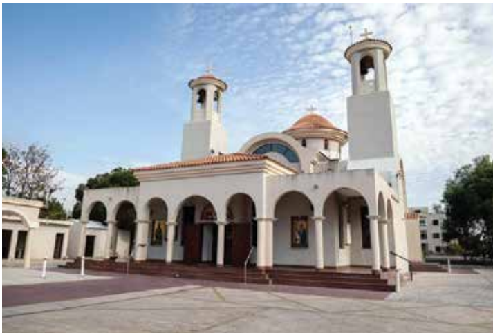
Ἱερὸς ναός Ἁγίου Στυλιανοῦ Λινόπετρας

«ΕΝΕΚΑΙΝΙΣΘΗ Ο ΠΑΝΣΕΠΤΟΣ ΟΥΤΟΣ ΝΑΟΣ ΥΠΟ ΤΟΥ ΠΑΝΙΕΡΩΤΑΤΟΥ ΜΗΤΡΟΠΟΛΙΤΟΥ ΛΕΜΕΣΟΥ κ ΧΡΥΣΑΝΘΟΥ, ΚΑΡΠΟΦΟΡΟΥΣΗΣ ΤΗΣ ΒΑΣΙΛΙΚΗΣ ΑΛΕΞΑΝΔΡΟΥ ΣΚΛΑΒΟΥ ΕΞ ΑΘΗΝΩΝ ΤΗ 5Η ΜΗΝΟΣ ΣΕΠΤΕΜΒΡΙΟΥ ΤΟΥ ΣΩΤΗΡΙΟΥ ΕΤΟΥΣ 1993», ὅπως σημειώνεται